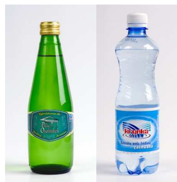
fot. 1 woda mineralna Krynka

jednak w tej strefie klimatycznej bywa, że temp spada do –30°C. Wtedy dodatkowym rozwiązaniem podnoszącym sprawność pomp powietrznych, jest skierowanie strumienia ciepła odpadowego ze sprężarkowni na moduły zewnętrzne pomp ciepła. Rozwiązanie takie podnosi sprawność układu i zapewnia ciągłą pracę nawet w mroźne dni. Inwestor jest zadowolony z funkcjonalności rozwiązania i zmniejszenia kosztów eksploatacji. Warto podkreślić, że zakład produkcyjny przyczynił się do ochrony środowiska redukując emisję CO 2 .