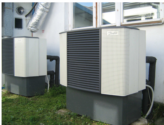
fot. 3 moduły zewnętrzne DHP-A i kanał wentylacyjny z ciepłem odpadowym

Danfoss Sp. z o. o. , ul. Chrzanowska 5, 05-825 Grodzisk Mazowiecki, Tel (22) 755 09 00, Fax (22) 755 07 01 e-mail: pompyciepła@danfoss.com , http:// www.pompyciepła.danfoss.pl , http:// www.danfoss.pl