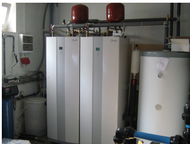
fot. 2 pompy ciepła DHP-A w kaskadzie