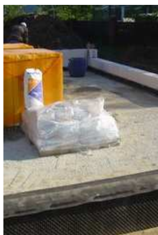
fot. 2 budowa domu pokazowego, fundamenty i ściany