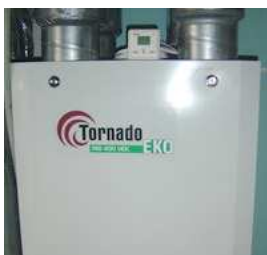
fot. 6 centrala rekuperatora

Dom został zbudowany przez kilkuosobową firmę bez specjalistycznego przygotowania i narzędzi. Stan surowy został wykonany przez 3 osoby w ciągu niespełna 2 miesięcy.