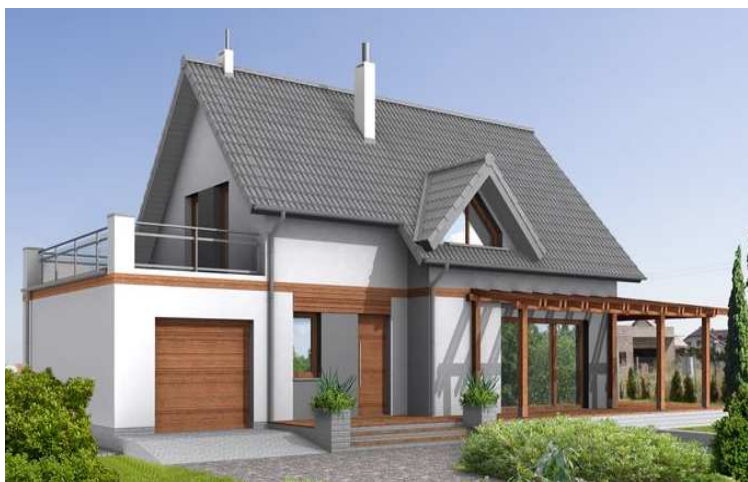
fot. 1 widok domu Tokio P190/L

Ocieplenie wykonano styropianem na zakładkę o grubości 15 cm klejonym bezpośrednio na ścianę bez użycia kołków, w celu uniknięcia mostków termicznych (fot.2, fot.3). Zastosowano specjalne okna energooszczędne (U=0,7) zrobione z 3 warstw szyb z tlenkiem srebra, które nie oddają ciepła na zewnątrz.