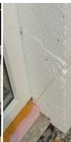
fot. 3 budowa domu pokazowego, ocieplenie