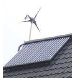
fot. 8 turbina wiatrowa i kolektor słoneczny