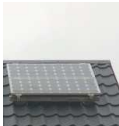
fot. 7 ogniwa fotowoltaiczne na dachu domu pokazowego