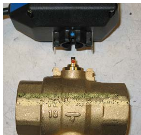
Położenie zaworu i siłownika do montażu.