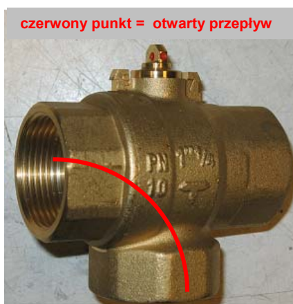
Normalna pozycja przy starcie – obieg c.o.