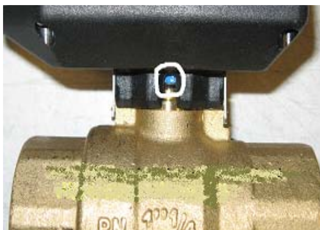
Pozycja startowa, niebieski punkt na silniku pokazuje, że zasilany jest tylko przewód czarny (24 VAC). Napięcie mierzone między przewodem czarnym i niebieskim.